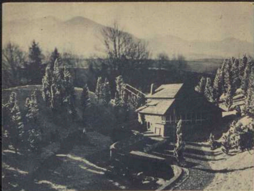
Makiety dolnej i górnej stacji wyciągu linowego na Szyndzielnię.