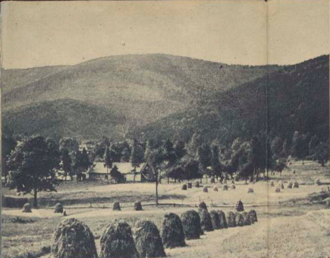
Powyżej: Widok z Bystrej na Szyndzielnię. Na prawo: schronisko PTTK na Szyndzielni, poniżej: krajobraz beskidzki w grupie Kłimeczoka i wiosk na Magurkę.